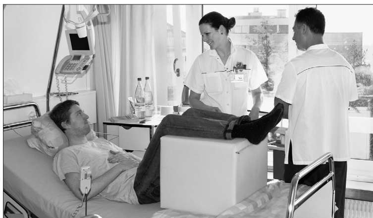
Immer mehr finanziell schwache Personen können ihre Krankenkassenprämien nicht mehr bezahlen. Zugleich wollen die Kantone bei den Prämienverbilligungen sparen.

Erfreulicherweise darf ein Kanton gemäss einem Bundesgerichtsentscheid die Einkommensgrenze nicht beliebig nach unten anpassen. Das sind gute Nachrichten für den Mittelstand. Das Obligatorium führte jedoch von Anfang an zu höheren Prämien. Selbstverständlich wäre es dennoch falsch, dieses aufzuheben. Damit würde eine Zweiklassengesellschaft geschaffen.