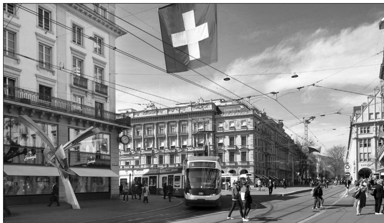
Auf Druck der OECD und der EU wollen Bundesrat und Parlament die Unternehmenssteuern (Bild: Paradeplatz in der Stadt Zürich) senken. Diese sogenannte STAF-Vorlage benachteiligt vor allem sozial schwache Schweizer.

«Bschiss». Dem Volk gehen 2 Milliarden Franken Steuern verloren, und als «Ausgleich» darf es zusätzlich mittels Steuer- und Beitrags erhöhungen die 2 Milliarden Franken bezahlen, die in die AHV fließen. Dies gilt auch für die Beitrags-hälfte, die von den Arbeitgebern zu entrichten ist, denn diese betrachten die Lohnkosten als Ganzes. Sie werden ihren Anteil an den Mehrkosten wieder hereinholen, indem sie bei den Löhnen noch knausriger sind als heute.