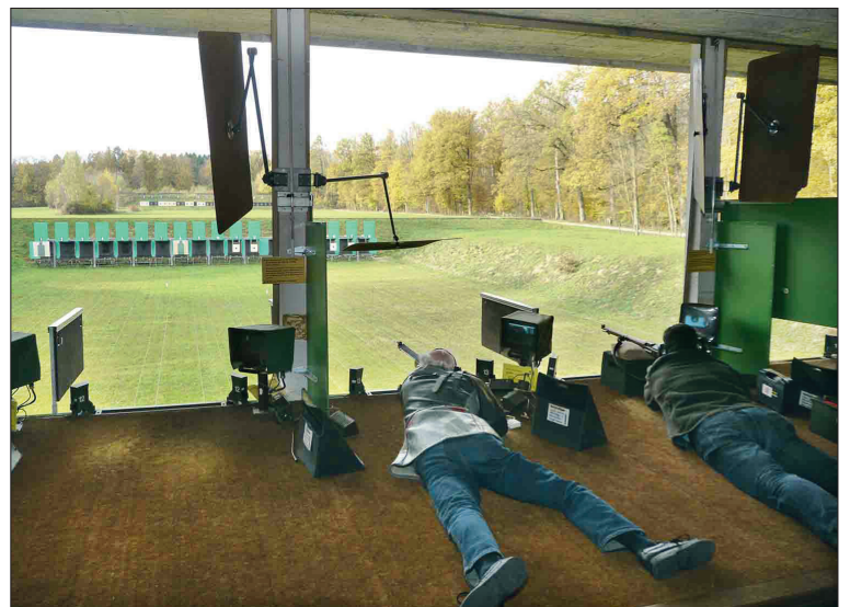
Mit der neuen EU-Waffenrichtlinie werden die traditionellen Freiheitsrechte der Sportschützen eingeschränkt.

Der weitgehende Verzicht auf Grenzkontrollen hat dazu geführt, dass Kriminelle unbehelligt in ganz Europa herumreisen und ihrem «Geschäft» nachgehen können. Die polizeiliche Zusammenarbeit im Schengenraum vermag konsequente Kontrollen an der Landesgrenze nicht zu ersetzen. Sie ist aber durchaus sinnvoll.