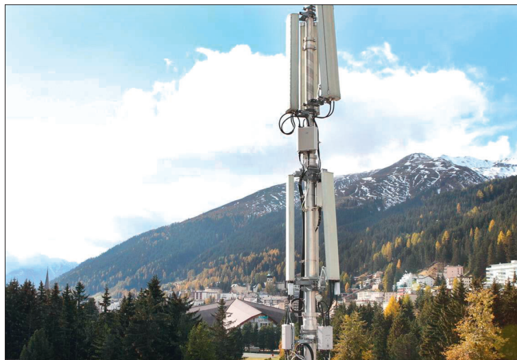
Die gesundheitlichen Risiken der 5G-Technologie sind immens.

Die Anbieter loben die neue 5G-Technik, sie sei schneller, zuverlässiger und leistungsfähiger. Die Reaktionszeit steigere sich von 25 – 38 Millisekunden der 4G auf nur eine Millisekunde bei der 5G. Dadurch wird das Surfen um ein Vielfaches schneller und die Kapazität der Datenübermittlung zehnmal effizienter. Ganze Filme könnten in Sekundenschnelle heruntergeladen werden und eine verzögerungsfreie Kommunikation wäre in Echtzeit möglich. Daraus ergäben sich unzählige Vorteile, zukunftsweisende Möglichkeiten und grosse Chancen, etwa für